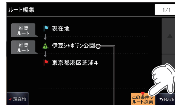
追加された経路地