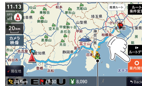
追加された経路地