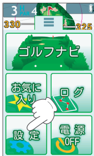
設定画面を表示します。