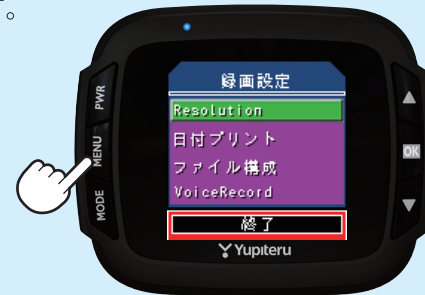
<動画記録モードの設定メニュー>