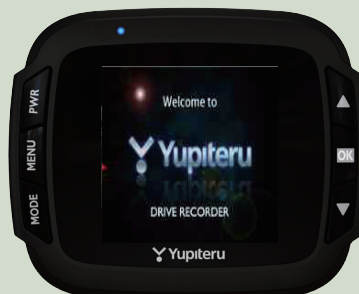
<オープニング画面>