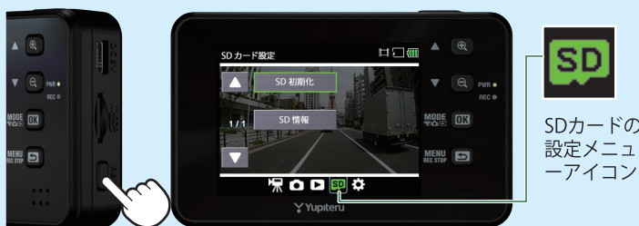
<SDカードの設定メニュー>