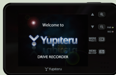
<オープニング画面>