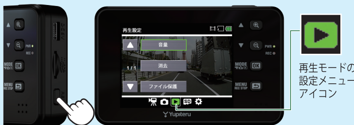
<再生モードの設定メニュー>