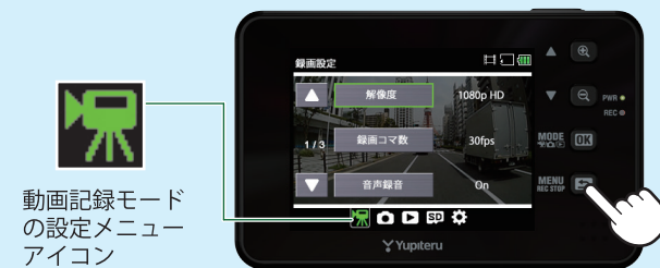
<動画記録モードの設定メニュー>