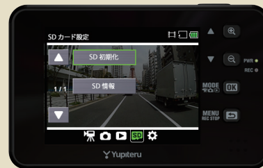
<SDカードの設定メニュー>

・SD初期化(フォーマット)が完了すると「SDカードの設定メニュー」に戻ります。