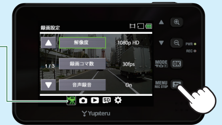
<動画記録モードの設定メニュー>