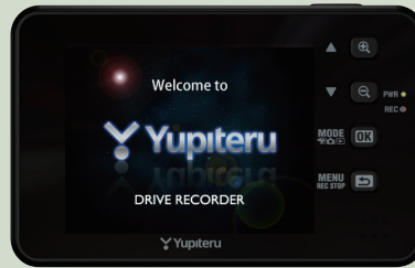
<オープニング画面>