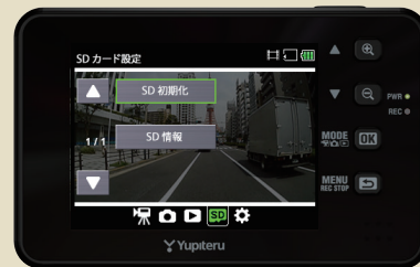
<SDカードの設定メニュー>

・SD初期化(フォーマット)が完了すると「SDカードの設定メニュー」に戻ります。