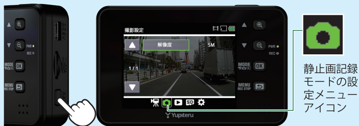
<静止画記録モードの設定メニュー>