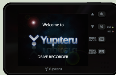
<オープニング画面>