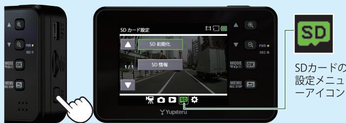
<SDカードの設定メニュー>