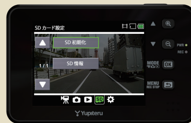
<SDカードの設定メニュー>

・SD初期化(フォーマット)が完了すると「SDカードの設定メニュー」に戻ります。