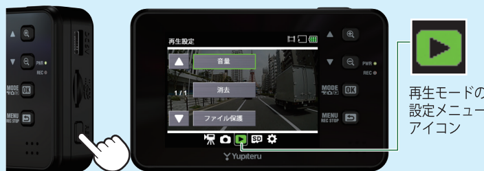
<再生モードの設定メニュー>