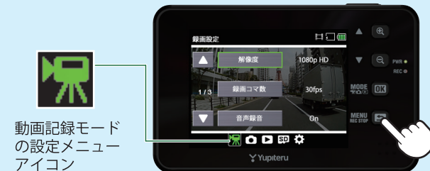
動画記録モード の設定メニュー アイコン