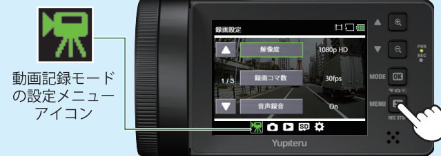
<動画記録モードの設定メニュー>