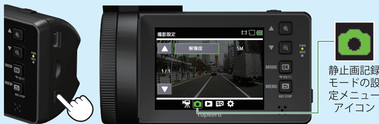
<静止画記録モードの設定メニュー>