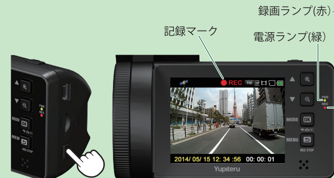
録画ランプ(赤) 電源ランプ(緑)