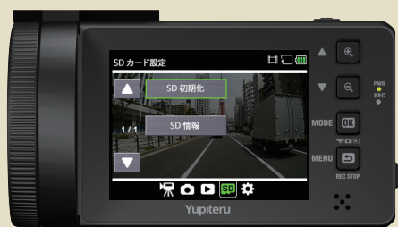
<SDカードの設定メニュー>

・SD初期化(フォーマット)が完了すると「SDカードの設定メニュー」に戻ります。