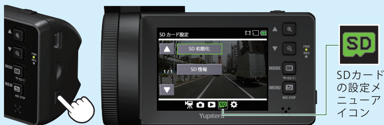
<SDカードの設定メニュー>