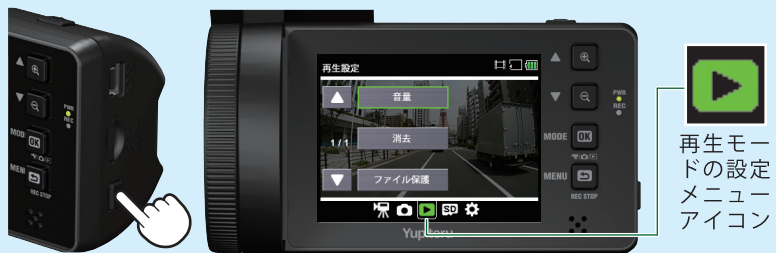
<再生モードの設定メニュー>