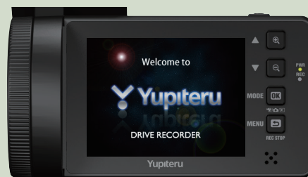
<オープニング画面>